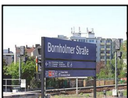
Berlin: Pankow, Reinickendorf, Wedding

Die Strecke führt entlang der Bezirksgrenze von Pankow und Reinickendorf nach Wedding, weiter entlang der S-Bahntrasse S-Bahnhof Wilhelmsruh, S-Bahnhof Schönholz, S-Bahnhof Wollankstraße zum S-Bahnhof Bornholmer Straße. Am Grenzübergang Bornholmer Straße kam es in der Nacht vom 9. November 1989 zur ersten Maueröffnung nach 28 Jahren. [ca. 5 km] Besonderheiten: Volkspark Schönower Heide, Sowjetisches Ehrenmal, alte Industrieanlagen, Bornholmer Straße