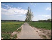
Berlin: Reinickendorf, Pankow

Der Mauerweg in diesem Abschnitt führt vorbei an dem Freizeit- und Erholungspark Lübars, dem Märkischen Viertel (Bezirk Reinickendorf) sowie dem Rosenthaler Park (Bezirk Pankow) und endet in Wilhelmsruh am S-Bahnhof Wilhelmsruh an der Kopenhagener Straße. [ca. 5 km] Besonderheiten: Lübars und Rosenthal (teilweise noch Blick in freie Landschaft), Märkisches Viertel